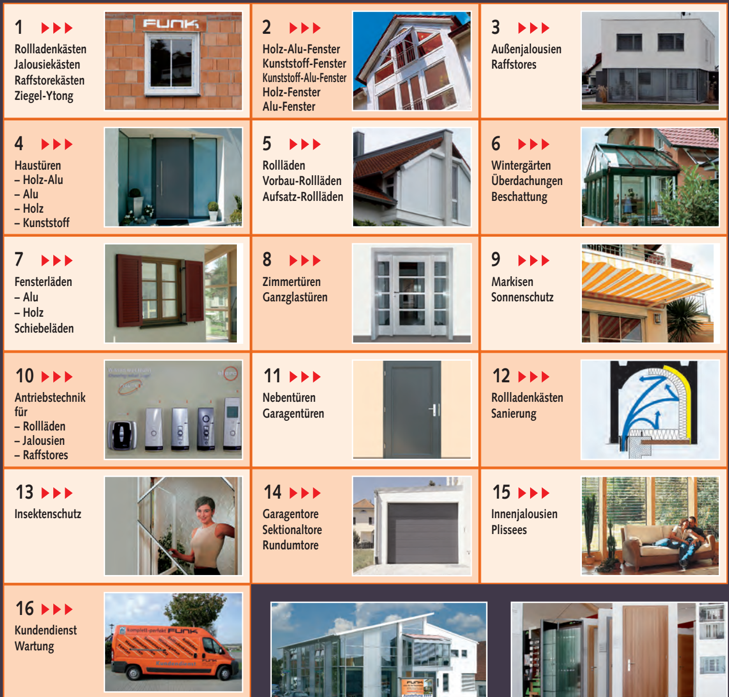
Auf 700 m 2 Ausstellungsfläche zeigen wir Ihnen unsere neuesten Produkte.